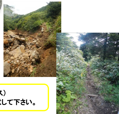
登山道(祓川コース) 足元(歩行)に注意して下さい。