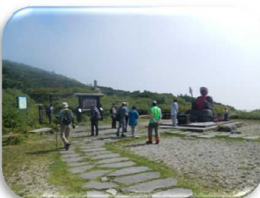
啓蒙活動 (現地の案内:普及活動)