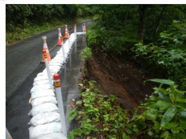
蔵王林道(路肩注意)