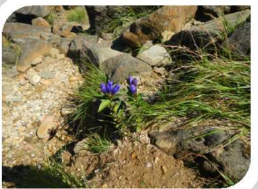
エゾオヤマリンドウ