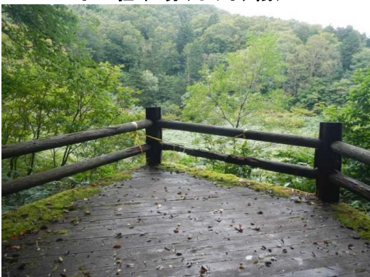
中央散策路メダマ沼