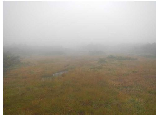
御田神湿原も視界不良