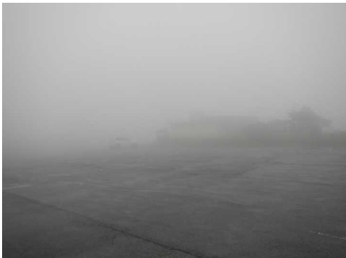
刈田駐車場(小雨、霧)

★9月19日 刈田駐車場、御田神湿原巡視。午後から蔵王林道、中央散策路 天気:小雨 気温10℃