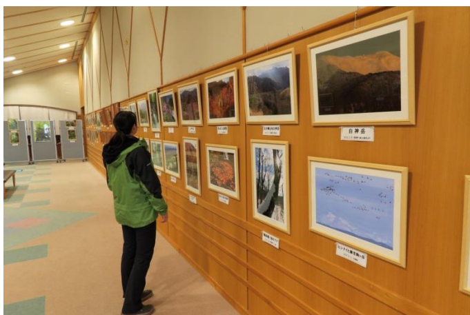
写真に目を凝らす来場者

ヒメホテイランが咲く頃に、地際にひっそり開花する陶磁器の様なウスバサイシン、アオモリマンテマが咲く一足先に岩壁を白く染め上げるエゾノイワハタザオ・・・希少種や固有種ばかりが注目されがちな白神山地ですが、普通種でもじっくり観察すれば色彩も姿も魅力的です。今回約120点の写真を展示していますが、特に力を入れたのは、これまであまり紹介されてこなかった若干通好み？の普