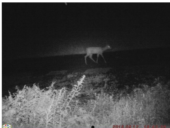
② 性別不明のニホンジカ

10月25日(火)、深浦町の深浦山国有林内(吾妻川下流域)にニホンジカ(以下シカ)捕獲用の小型囲いわな①を設置する予定です。ここでは昨年9月に性別不明のシカが撮影されたため②、設置箇所として選定しました。