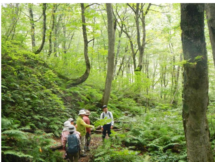
本事業の目指す姿である天然林の 散策を行いました

もので、活動終了後は、周辺のブナ林の散策を行っています。森林内での作業を行ったことがない方でも気軽に出来る内容となっており、今年度の参加者は、採取した大きめの稚樹をスコップで自ら穴を掘ってそのまま植え込み、小さめの稚樹は自ら作成したカミネッコンに苗木と土を入れ林内の安定した場所に置くといった作業を実施・体験しました。100年後を見据えたブナ林再生の作業に、参加者からは充実感を感じるコメントを多くいただいたところです。