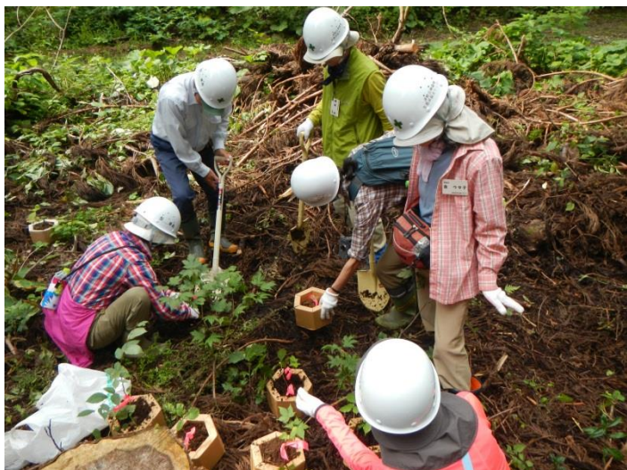
カミネッコン（段ボール素材のポット） を使用し植樹しました