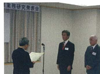
業務研究発表会表彰式