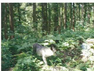
8月2日 ニホンカモシカ