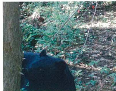
6月11日 ツキノワグマ