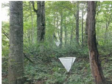
シードトラップの設置

これらを本年度6月、活動拠点4の抜き伐り箇所、活動拠点13の苗床予定箇所に播種する予定である。