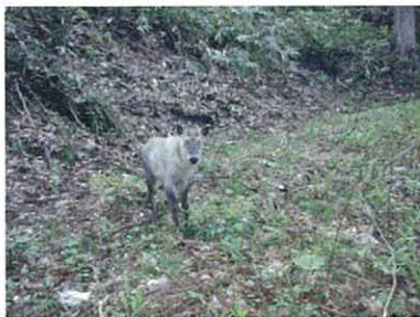
5月17日 ニホンカモシカ