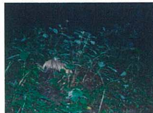
8月16日 ニホンアナグマ