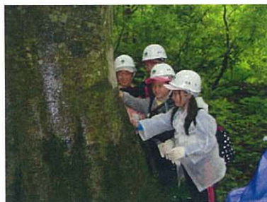
ブナ巨木に触れて