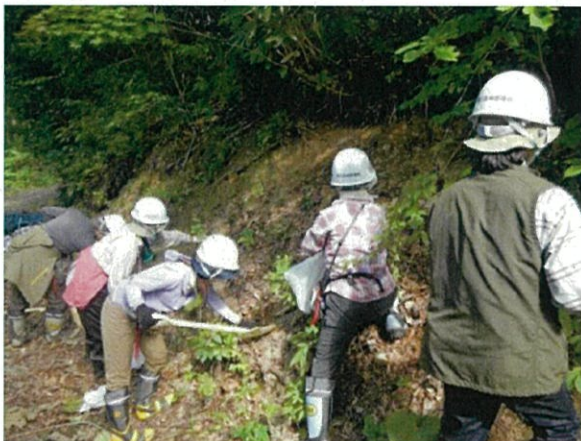
【作業道のり面からブナ稚樹を掘取り】