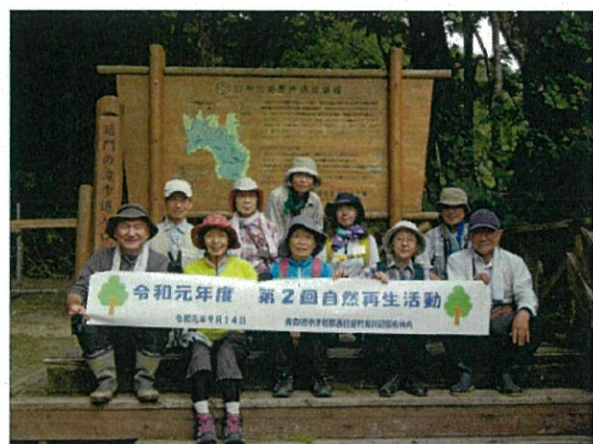
【津軽植物の会のみなさんが多数参加】