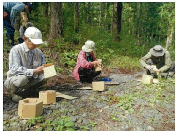
【カミネッコン（段ボール植木鉢）作成】