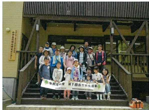
【たくさんの方がご参加いただきました】