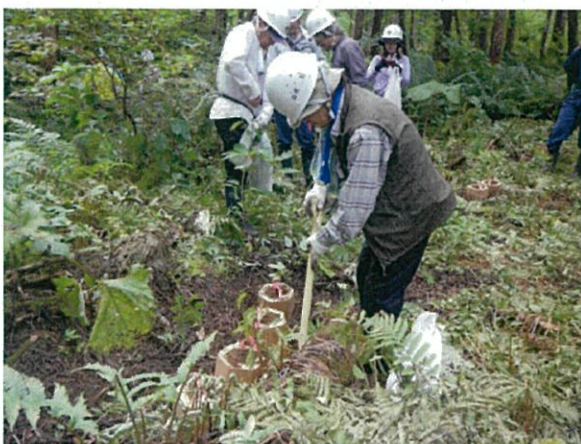
【カミネッコンに植えた稚樹を存置】