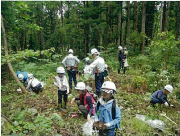
【参加者全員で広葉樹苗を植え付け】