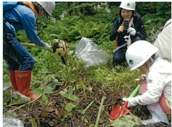
【広葉樹苗の掘り取り】