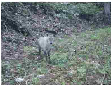
5月17日 ニホンカモシカ