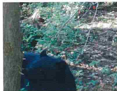
6月11日 ツキノワグマ