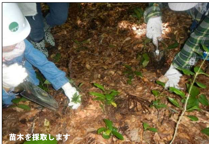
苗木を採取します