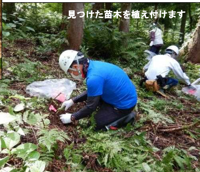
見つけた苗木を植え付けます