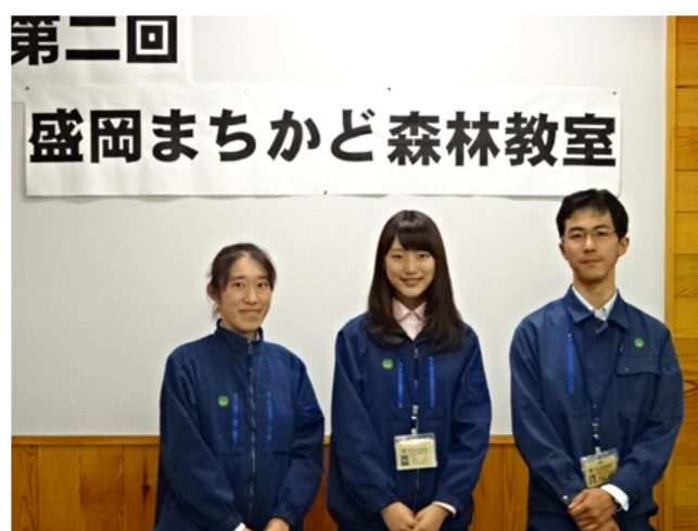
第2回の企画運営スタッフ（一部）