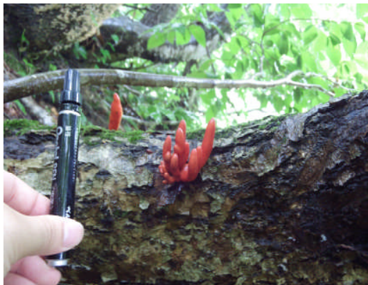
まれに幹に発生: 小国町25.7.24撮影

ニクザキン目、ニクザキン科の猛毒きのこ。毒性が強く、食べても、触っても毒である。死亡例もあり、後遺症が残って小脳が萎縮するとの報告あり。オレンジがかった赤色で、形は棒状かとさか状。