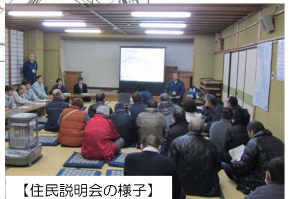
【住民説明会の様子】