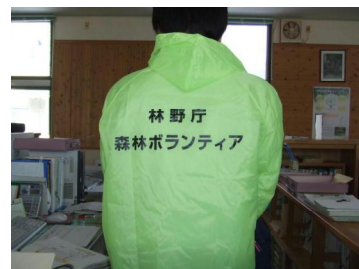
蛍光ヤッケ 活動時に配布予定