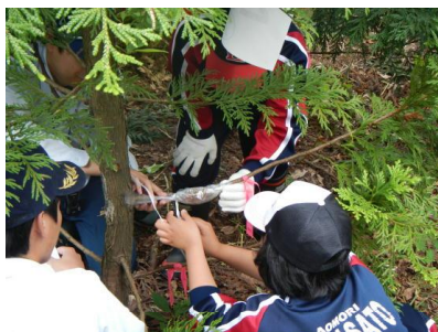
水苔を巻き付けている様子