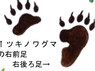
↑ツキノワグマの右前足 右後ろ足→

里には春が訪れましたが、山はまだ厚い雪に閉ざされています。堅雪になったこの時期はトレッキングに最適。様々な動物の足あとが見つかります。写真は十一月のもので、隣に置いたポールペルでその大きさがわかりますよ。ほかに齧った跡、爪の跡、フンなどの痕跡を「フィールドサイン」と言います。めったに会えない野生動物の生活を想像させてくれますね。