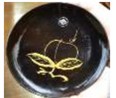
桃が描かれた絵皿

浄法寺総合支所二階にある漆絵皿展示室。ここに並んでいるのは、かつて一軒に二〇〇三〇枚揃えられ、野良仕事のおやつを取り皿などに使われてきた絵皿たちです。現在の漆器との大きな違いは、簡素な絵付けがなされている点。桃、銀杏、松、梅、南天などの縁起物が描かれています。一見誰にでも描けそうですが、思いきりよく筆を運ばなければならぬ難易度の高い仕事です。多種多様な絵柄が当時の暮らしに彩りを添えていたのでしょうね。