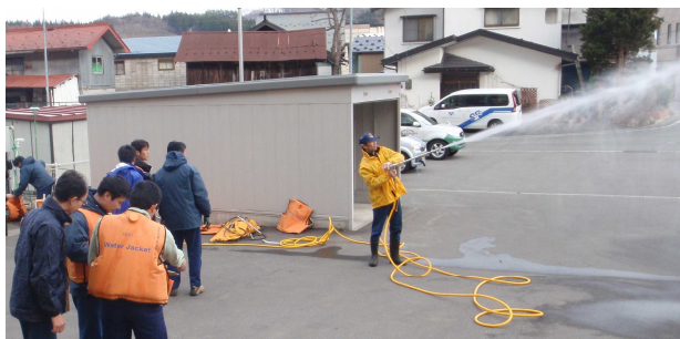
消火ポンプでの訓練