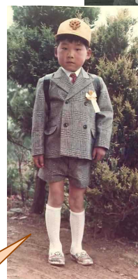
(あまりに可愛くて選べず 2枚載せました)