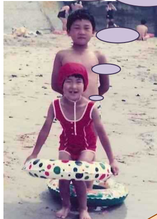
(手前の赤い水着の子)