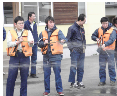
ジェットシューターの点検

今年度も、林野庁は「平成 25 年度全国山火事予防運動実施要綱」を定め、消防庁等が実施する「春季全国火災予防運動」にあわせて「全国山火事予防運動」の実施を呼びかけています。岩手北部署でも、山火事を消火する消火器具の点検と、使い方の訓練を署内全員で行いました。