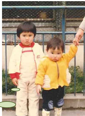
(左側の白いズボンの子)