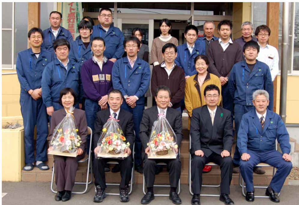
定年退職者を囲んで