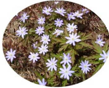
キクザキイチリンソウ