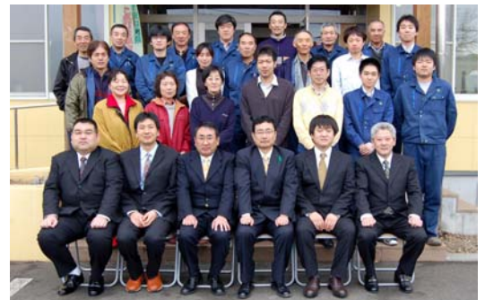
平成22年4月1日付け 転任者を囲んで

平成18年に盛岡署から配属になり4年間お世話になりましたが、盛岡署に戻ります、ありがとうございました。