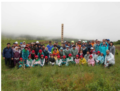
記念標柱の前での記念撮影

八幡平市丑山牧野で、6月7日(日)に「豊かな未来の森林」植樹祭が開催されました。植樹祭には、市内の渋川・細野両森林愛護少年団、盛岡農校の生徒、一般公募による市民ら約80人が参加、ブナ、ナラなどを植樹しました。