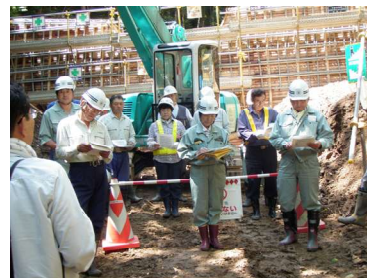
安全管理担当者会議における意見交換 （小杉沢治山工事）

24日（水）に山本建設が実行中の小杉沢治山工事箇所において、安全管理担当者会議を開催しました。当日は、当該工事箇所における安全対策の考え方及び実施状況について、説明を受けるとともに、自分達の安全対策に活かさないかとポイントに意見交換を行いました。