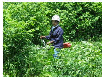
電動刈払機の講習

夏山事業も4ヶ月目に入り、直営事業、請負事業もこれから最盛期を迎えますが、蜂災害の危険期や暑さも厳しくなるなど作業環境も厳しくなる季節でもあります、体調管理にも十分気をつけ無災害の継続と業務計画の確実な達成に向けて最後まで努力をお願いします。