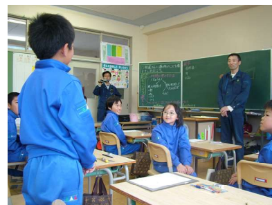
森林に出かける前の事前学習 (田山小)

実施にあたり署側と学校側が事前に開催内容・テーマについて打ち合わせを行い、(安代小学校は5月29日の「事前学習」に始まり、6月3日「安比二次林」、7月2日「滝沢村国立青年の家」、8月28日、10月14日の「あっぴ高原遊々の森」)(田山小学校は5月12日の「事前学習」に始まり、6月2日「田山地区愛の森」7月2日「滝沢村国立青年の家」、9月29日「四角岳」)においてそれぞれ実施しますので、職員のみなさんに講師のご協力よろしくお願いします。