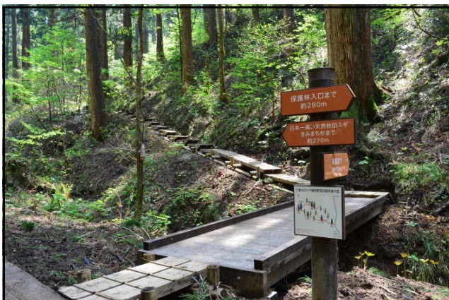
新しくなった木道・木橋（仁鮎）