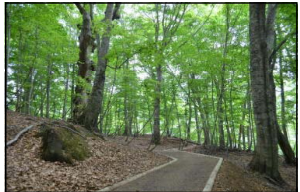
二次林に増設したウッドチップ歩道（岳岱）

岳岱のブナ林と仁鮎の天然秋田杉林を訪れる多くの方々が安心して自然に親しみ、リフレッシュしていただけるよう 保全管理していきたいと考えています。