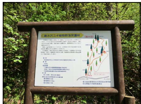
新しくなった案内板（仁鮎）