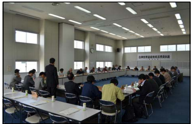
白神山地世界遺産地域巡視員会議 (八峰町文化交流センター・ファガス)

白神山地世界遺産地域巡視員会議（秋田県側）が6月1日（金）八峰町ファガスで開催され、遺産地域連絡会議の関係機関をはじめ巡視員、関係市町の担当者ら42名が出席しました。はじめに連絡会議を代表し、東北森林管理局計画課長より「巡視員をはじめ地域の皆様の努力により良好な管理が出来てきている。しかし、一部の方による立木の損傷事案が依然として発生している。引き続き安全と健康に留意し、適切な巡視活動をお願いします」と挨拶があり、続く出席者紹介の後、