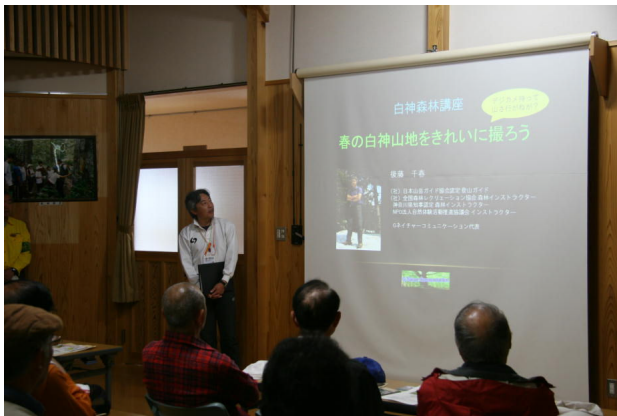
昨年の森林講座（撮影ワンポイント・アドバイス）