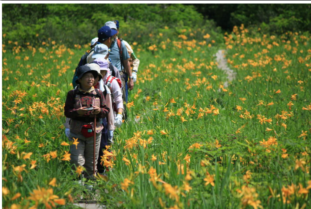
昨年の藤里駒ヶ岳登山(田苗代湿原にて)