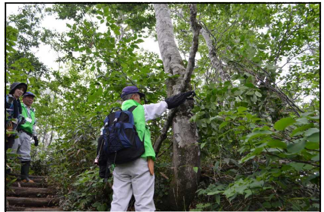
登山道上の枯れ枝を除去 (ニツ森コース)

両コースとも立木の損傷、植物の盗掘、ゴミの投棄などの違法行為は確認できませんでした。