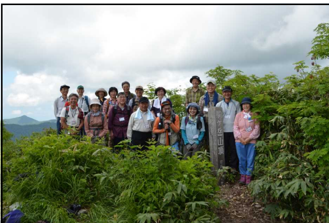
皆さん笑顔です（藤里駒ヶ岳）

7月5日（土）今年度2回目となる白神森林講座「大展望の藤里駒ヶ岳と榎岱のブナ林」を開催しました。