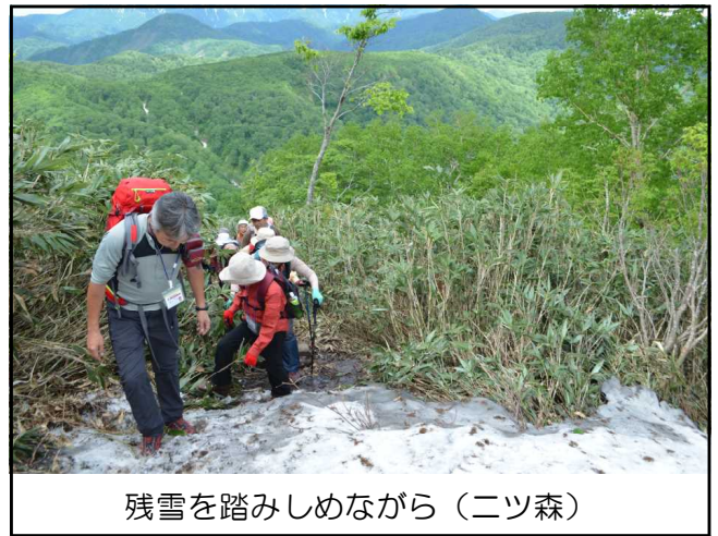
残雪を踏みしめながら（ニツ森）

下山後ニツ森登山口で昼食を取り、留山にてブナ林の散策を行いました。後藤講師から留山のブナ林の特徴や写真の撮影方法の説明を受け、参加者の皆さんは熱心に聞き入っていました。