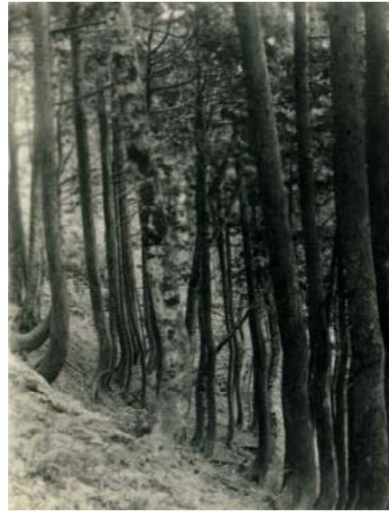
写真-3 稚樹の見られないヒバ林 (昭和20年代後半)