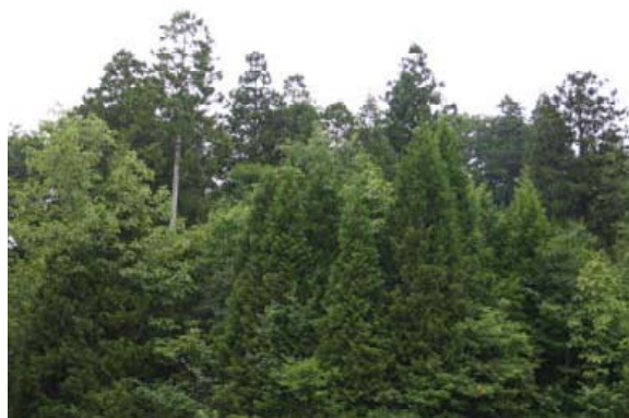
写真-2 ヒバ・広葉樹複層林（下北半島）

可能とするヒバ複層林にするため、ヒバ苗を樹下植栽するなど、集約的な施業を更新が完了するまで繰り返し実施していたと考えられます。