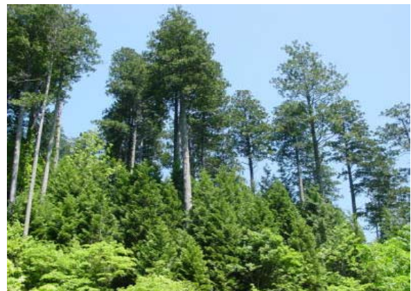
写真-4 樹下植栽によると思われる ヒバ2段林