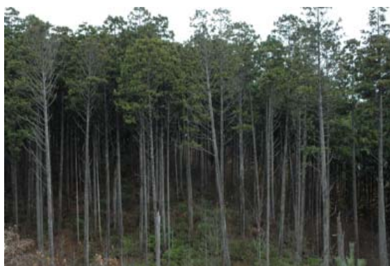
写真-1 ヒバ単層一斉林（津軽半島）