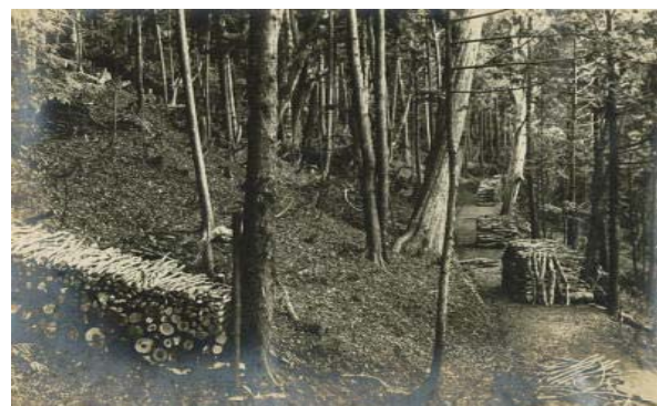
写真-5 造林作業実施後の林内の様子 (大畑実験林、昭和10年頃)