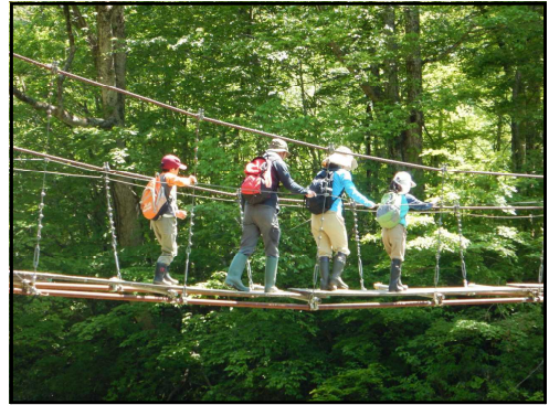
(吊り橋を渡る親子)

朝日庄内森林生態系保全センターでは、朝日山地の森林や自然の働きを体感し自然とのつきあいかたを学ぶ体験活動型森林環境教育等を行うため、各団体の協力を得ながら「朝日自然塾」を開催しています。今年、「山の日制定 8.11」記念と題して5回計画しました。第1回目は地元山形県小国町の共催により、5月22日(日)に「マタギ文化とやまの幸 新緑のブナ林教室(白布平)」を置賜森林管理署管内で開催しました。