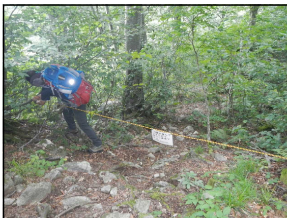
外れたロープの補修

1日目の行程は、12時にセンターから車両に乗り合わせて泡滝ダム登山口へ向かい、途中、七曲がりでは登山道を外れてショートカットする登山者がいるため山腹が荒廃している箇所があり、今年度センターの新たな取り組みとしてショートカットを規制するロープを設置したことから、山荘までのパトロールに合わせて点検しながらタキタロウ山荘へ向かいました。