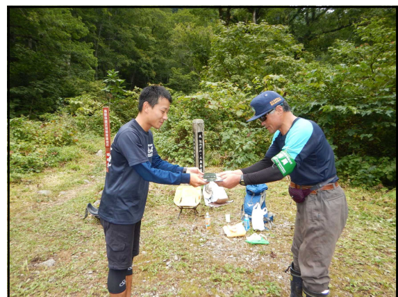
登山者へマナーガイドの配布

環境省では朝日山地の保全作業（主に登山道の補修・保護）を実施しており、当センターでも資材提供や保全活動に参加していますが、当センター主催の保全作業の可能性についても検討したいと思います。