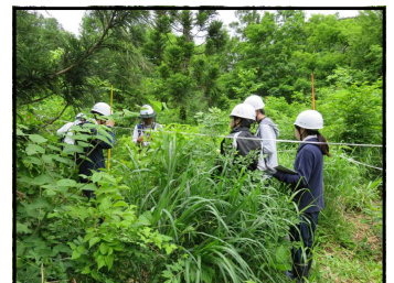
雨でびしょ濡れになりながら調査

今後、2箇所のプロットにおいて、地元鶴岡市のあさひ小学校5年生による更新補助作業(下草刈り、つる切り)や、山取苗、実生苗の植栽を予定しており、経年のモニタリング調査で、どのような状況変化が現れるのか大変興味深いところです。