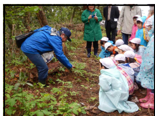
植物観察(ウラシマソウ)

最後の振り返りでは、花の名前や、触っては行けないウルシを確認し、家に帰って家族に報告することとしました。