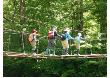
吊り橋を渡る親子

当センターでは、朝日山地の森林や自然の働きを体感し自然とのつきあいかたを学ぶ体験活動型森林環境教育等を行うため、各団体の協力を得ながら「朝日自然塾」を開催しています。第1回目は開催地山形県小国町の共催により、5月22日(日)に置賜森林管理署管内で開催しました。開催場所は朝日連峰の南側登山口(針生平)から白布平までの約1.5kmの登山道を2時間かけて歩き、はじめに、吊り橋の歩き方、地図の見