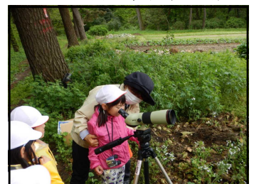
野鳥観察(シラサギ)