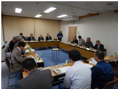
活発な意見交換が行われました

平成27年12月11日（金）、毎年度開催している朝日自然塾連絡協議会を、協定締結団体9団体の代表者及び東北森林管理局、庄内・山形・置賜森林管理署、当センター計19名で、①平成27年度実施の5つのプログラムにおける評価及び反省点並びに改善点、②平成28年度実施予定プログラムの検討、等を議題に協議、意見交換を行いました。