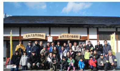
とても賑やかなイベントとなりました