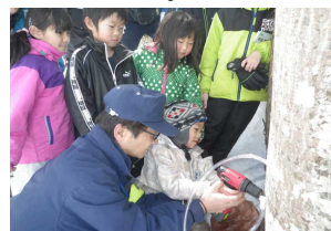
メイプルシロップ原液採取

労していましたが、歩き出すと慣れたのか走り出す子供達もおり、冬芽や動物の足跡を観察しながら和気あいの雰囲気を楽しんでいただきました。