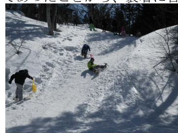
ソリ滑りに大はしゃぎ