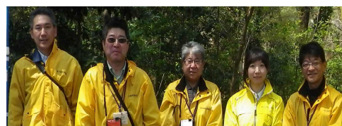
センター職員一同

には、なかなか厳しい山行ではなかったかとは思いますが、必死について来てくれた事に、職員皆が励まされました。来年度は厳しい体制になることが想定されますが、山行と同様、一步いっぽ歩みたいと思います。（おぐ）