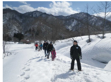
慎重に足を進めます

住民の方々と入念に打合せを行うとともに、既存のプログラム内容を大幅に見直し臨みました。その甲斐があったのでしょうか、参加者が26名（うち外国からのお客様6名）という大変好評な募集結果となりました。