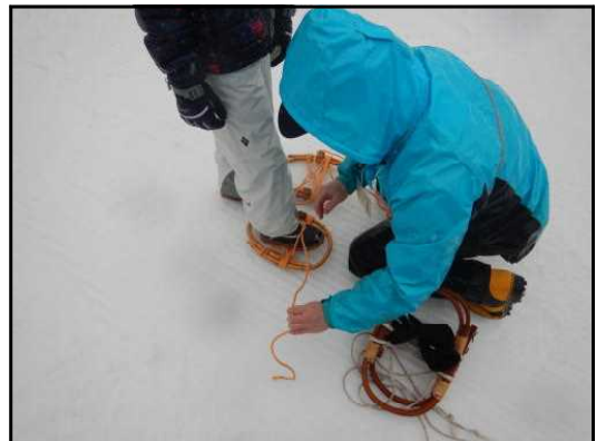
かんじきを履く様子

かんじきは初めてという方がほとんどで、職員から履き方を教わりながら長靴に縛り付け、慣れない足取りで雪原の中を楽しんでいました。