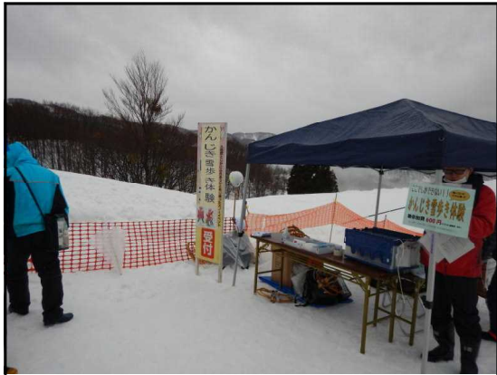
かんじき体験受付場所

2月19日（日）に山形県鶴岡市朝日地域の冬のイベント「月山あさひ雪まつり2023」が湯殿山スキー場において開催され、当センターも実行委員会から「かんじきde雪歩き体験」への参加協力依頼があり、庄内署と合同で参加しました。