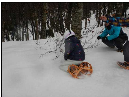
ブナの殻斗(かた)の観察

かんじき体験では、ブナの殻斗や樹木の冬芽、動物の足跡など冬の自然を観察しながらコースを回り、参加者もとても興味を持っているようでした。