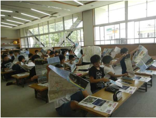
6月27日(火)森林整備について事前学習の様子

当日は小雨の中、合羽を着ての作業で蒸し暑く大変でしたが、けがもなく無事に作業を終えることが出来ました。