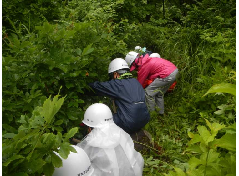
手鎌を使っての刈り払いを真剣に行いました。