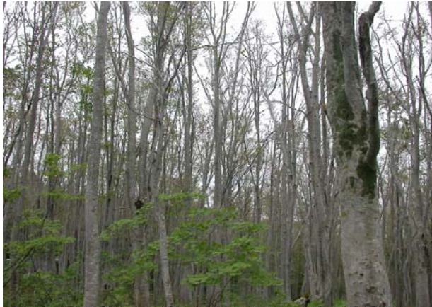
食害で葉がなくなったブナ林

食害は、ブナが分布する標高帯のうち、上部の方の標高差200mのところ帯状に発生し、標高の低いブナ林では大発生は見られません。