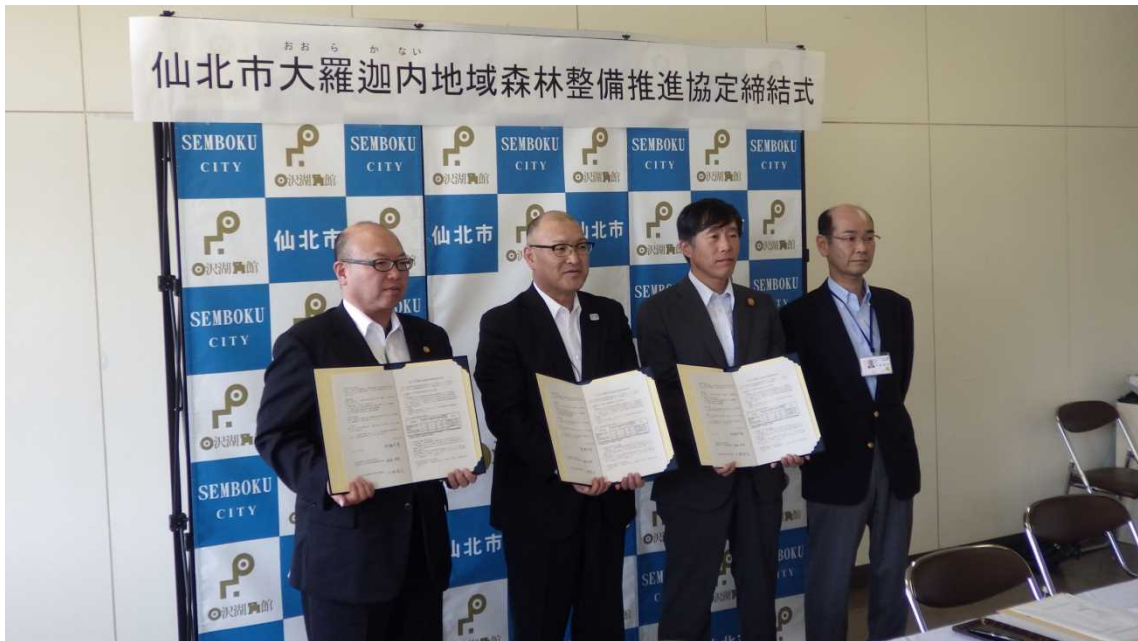
（左から、秋田水源林整備事務所神尾所長、仙北市門脇市長、秋田森林管理署二村署長、秋田県仙北地域振興局森づくり推進課小坂課長）