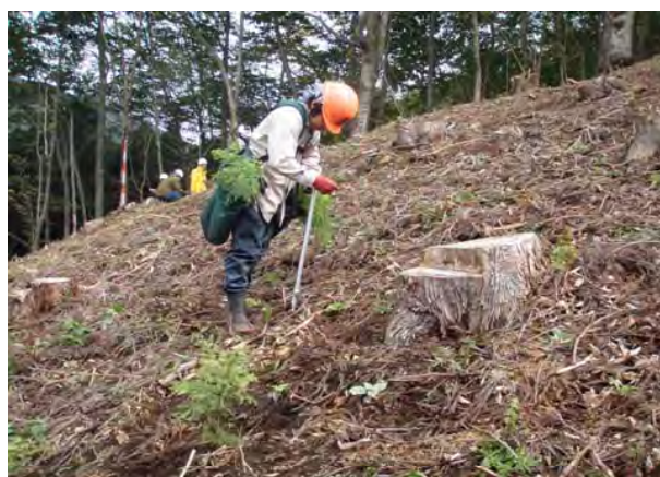
写真-10 宮城県苗組式で植付している様子