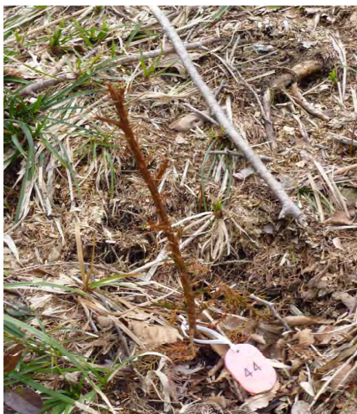
写真－11：ウサギ等食害