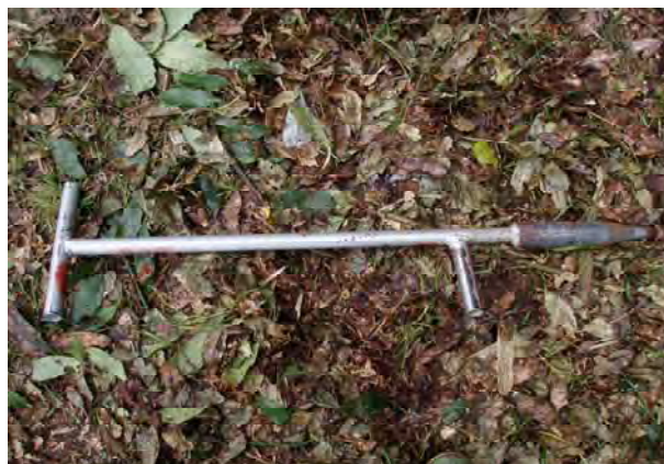
写真-8 宮城県苗組式 シルバーで先のとがった円柱形