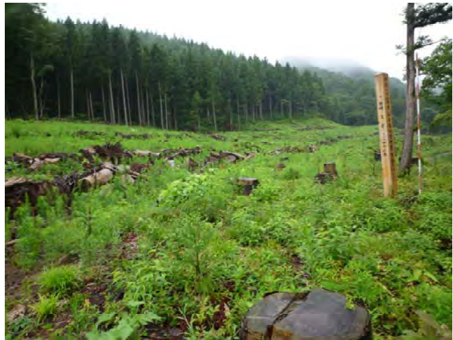
写真－６ 植付け後の現地