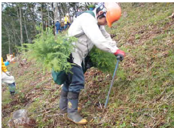
写真-9 スペードで植付している様子