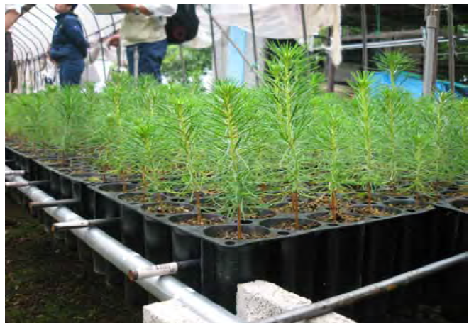
写真－3 育苗棚に取り付けたコンテナ