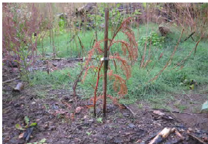
写真－13：倒伏した苗木（コンテナ苗大）