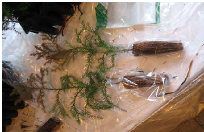
写真－4 コンテナからはずしたコンテナ苗