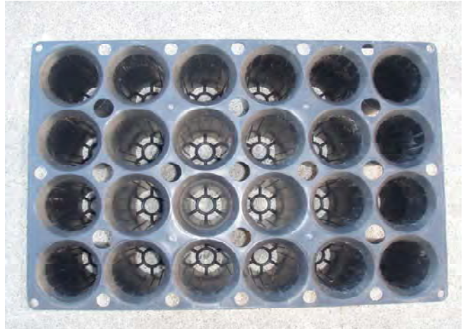
写真－2 上から見たコンテナ