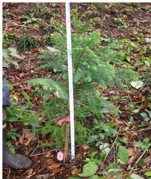
写真－12：徒長苗（コンテナ苗大）