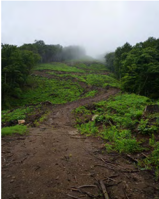
写真－５ 植付け前の現地