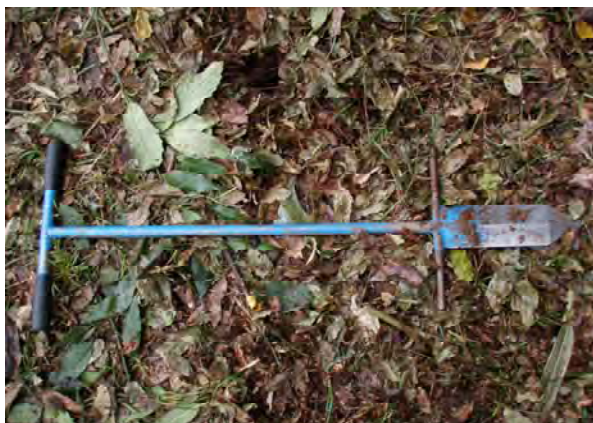
写真-7 スペード 青色で洋刀に似た形

* コンテナ苗大とは苗高50cm以上で根の部分が300cc、コンテナ苗小とは苗高50cm未満で根の部分が150ccである。普通苗は一般的に用いられるスギの苗木である。また、普通苗は唐鋤植栽のみとなる。