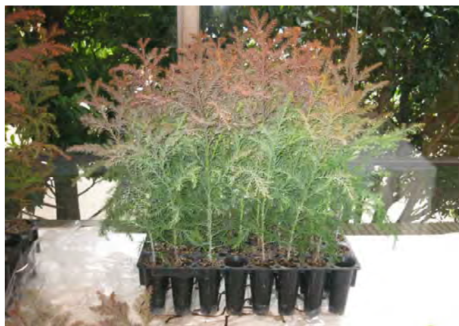
写真－1 コンテナにより養苗中のスギ苗

耐久性のある硬質プラスチックで繰り返し使え、容器全体をトレイと言い、日常的には単にコンテナと言い、コンテナで育てた苗をコンテナ苗と称している。