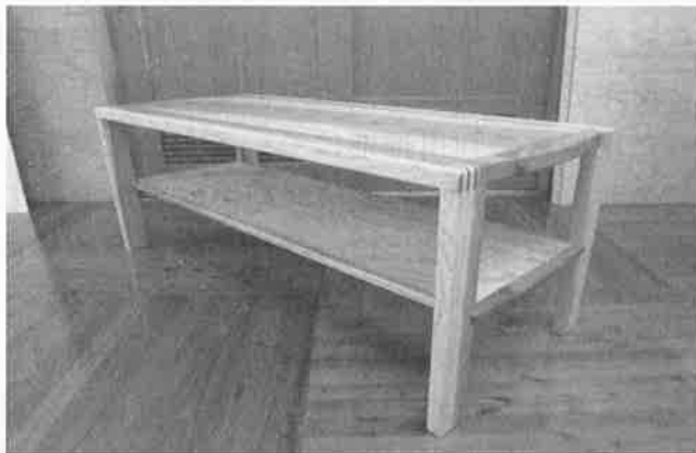
ローテーブル（天板、中板に合板使用）

県産スギ材合板と県産無垢スギ材を組み合わせ、仙台たんすの伝統手法を用い、洗練された10点の試作品ができました。