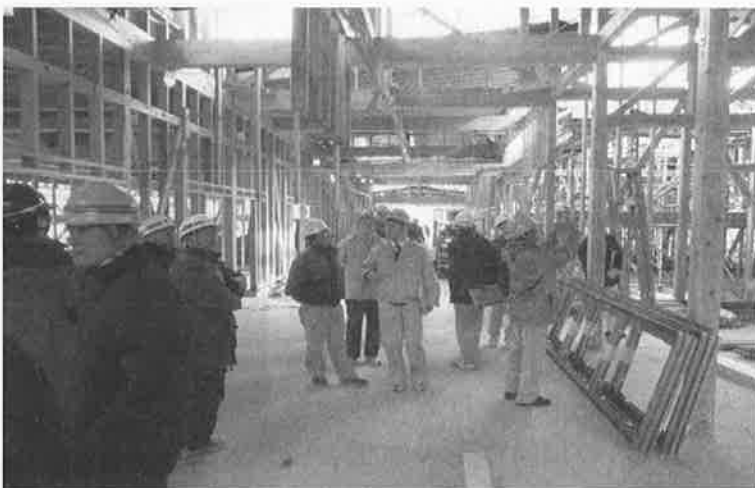
建設中の木造公共施設を見学

合板を含めた地域材の利用推進に向けて、木造施設の設計方法、仕様書における材料の指定方法等具体的な情報交換を行った他、建設中の公共施設や木造の社会福祉施設を視察し、地域材の利用状況を確認しました。