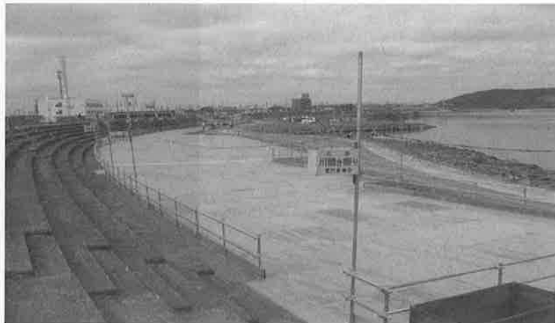
花火大会観客席に1,100枚の県産スギ材合板を使用

毎年20万人の来場者を集める「石巻川開き祭り花火大会」の有料観客席に、これまでの外国産材合板に代えて、県産スギ材合板の利用を商工会議所に働きかけ、県産スギ材合板1100枚の利用に結びつきました。