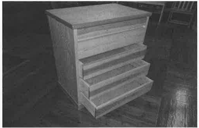
チェスト（天板に合板使用）