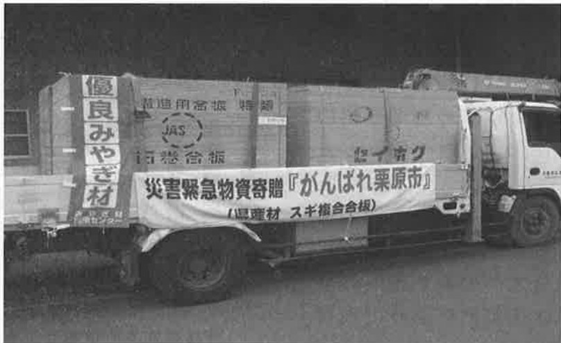
被災地に500枚の県産スギ材合板を提供

平成20年に発生した「岩手・宮城内陸地震」で被災した栗原市に対し、一日も早い復旧の一助となるよう建築材料として汎用性が高い県産スギ材合板500枚を救援物資として提供し、仮設住宅の資材等有効に活用されました。