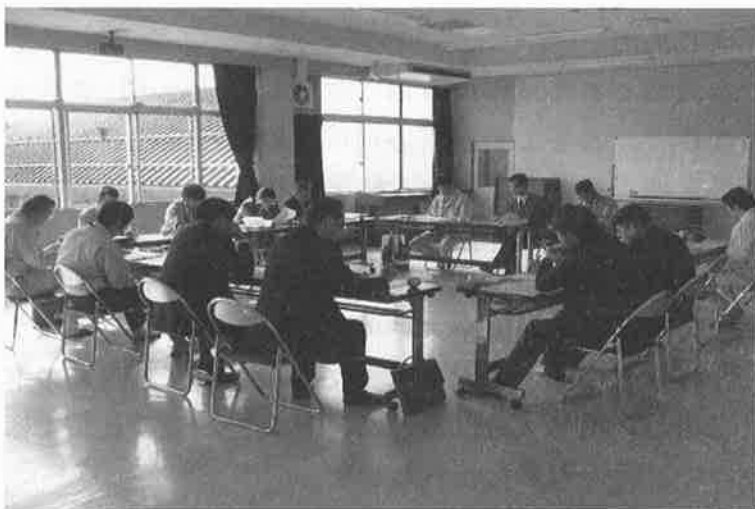
石巻地区公共施設地域材利用推進会議

石巻地域の市町が民間需要の先導役として率先的に地域材を活用し、地域の木材関連産業、住宅関連産業の活性化につなげることを目的に、市町の公共施設建設担当職員を対象として「石巻地区公共施設地域材利用推進会議」を開催しました。