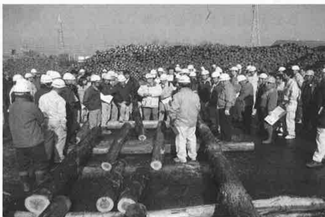
合板用原木品質管理研修会