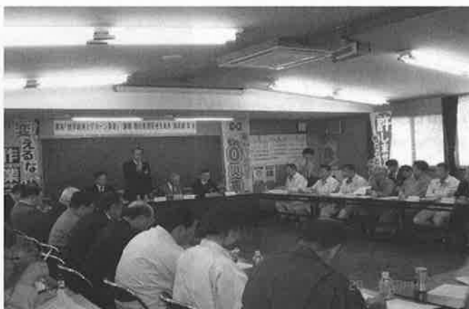
合板用県産材の供給等に関する検討会

具体的な活動としては、宮城北部流域森林・林業活性化センター石巻支部と連携し、原木の需給調整の場として「合板用県産材の供給等に関する検討会」を設立・開催し、供給者と需要者の合意形成により原木供給目標を定め、地域が一体となった原木供給体制を構築したほか、納入時期、各種要望事項の調整