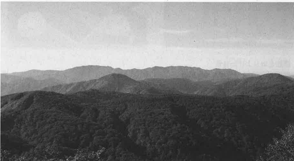
二ツ森から白神岳を望む

秋田県側の遺産地域は、二ツ森、小岳の登山コースしか原則入山が認められていません。岳岱自然観察教育林のように、子どもからお年寄りまで手軽にふれあえるフィールドは貴重であり大切だと考えています。これからも地元の方々と連携し協力を得ながら、遺産地域及び周辺地域の保全・管理に積極的に取り組んでいきたいと思えます。そして、白神山地を後世に守り継いでいこうという気運がどんどん高まるよう熱望します。