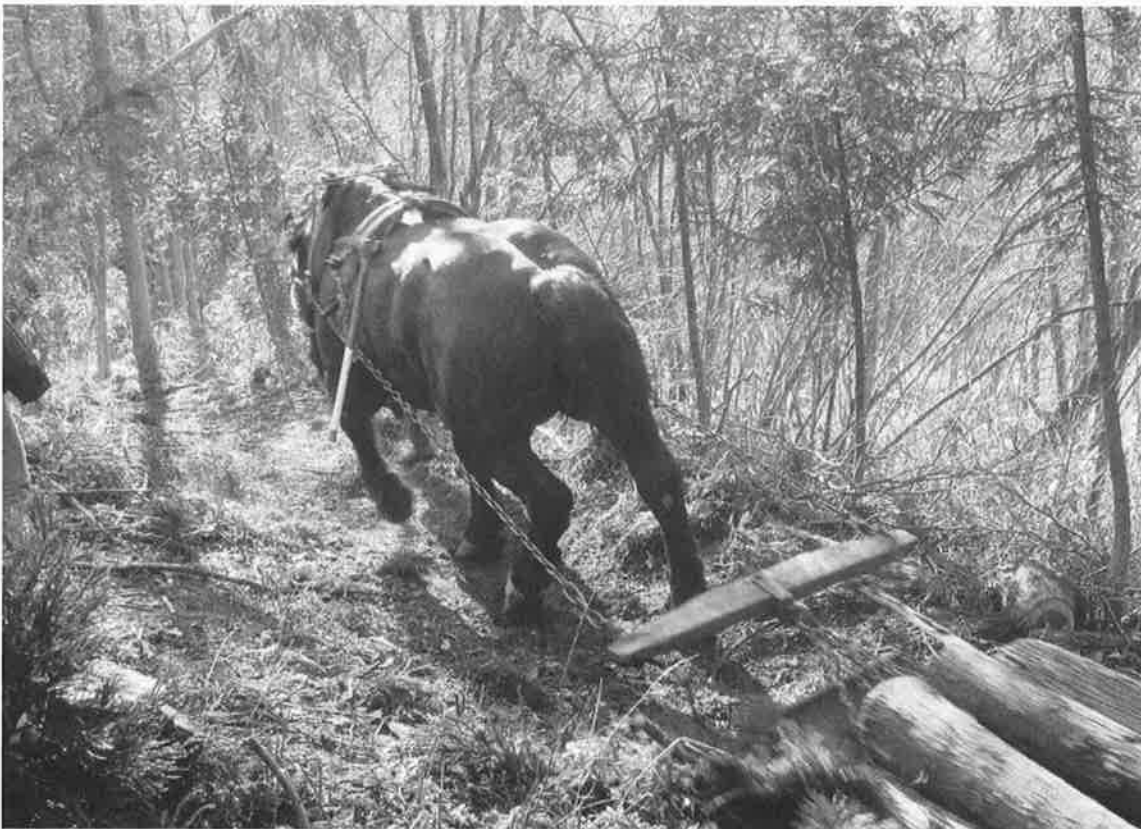
図1 丸太搬出の様子

そこで本研究では、馬主への聞き取り調査、機械作業との搬出コスト比較、ビデオによる作業分析を通して、馬搬が現在でも成立している条件について明らかにすることを目的とした。