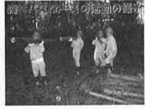
植樹祭からいろいろ学びました