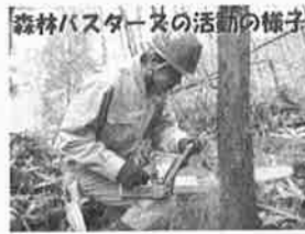
森林ハスターズの活動の様子

私たちは、今、このときを大切に、残り1年の学校生活を有意義に過ごし、自然と共存するための術 すべ を学んで卒業したいと思います。