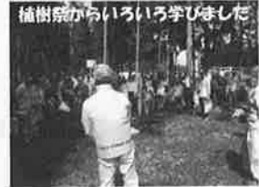
植樹祭からいろいろ学びました