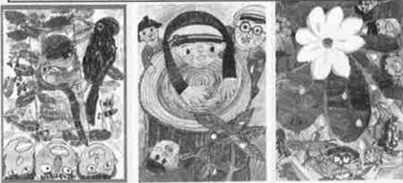
竜森小学校 1年級部 竜誠