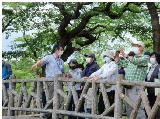
橋から森林鉄道の跡地を見学