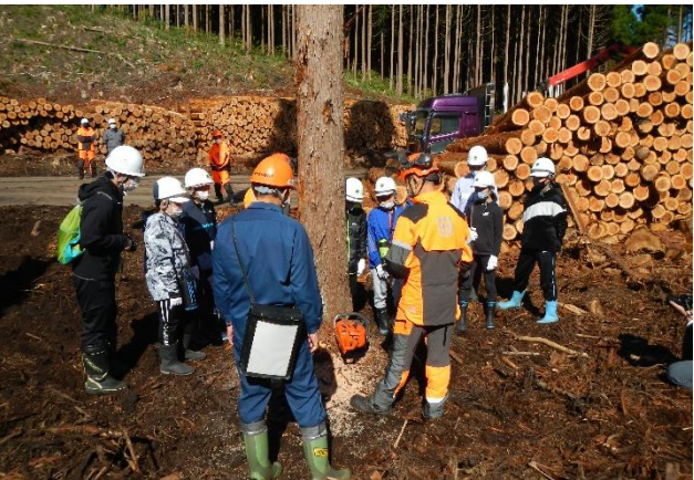
製品生産請負現場での説明