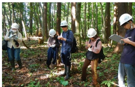
説明を熱心にメモ