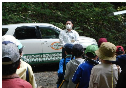
森林の働きについてのお話