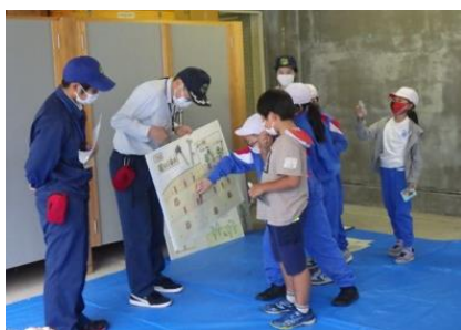
紙芝居に参加する子供たち