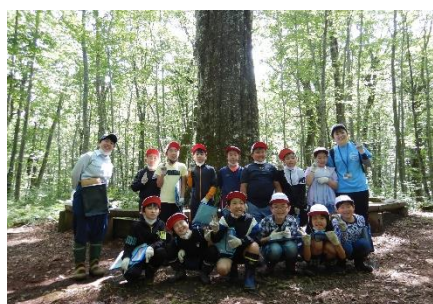
ブナの巨木前での記念写真