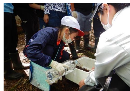
流れ出る水の速さや色を観察