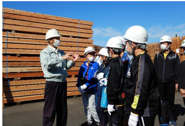
木材加工センターでの説明