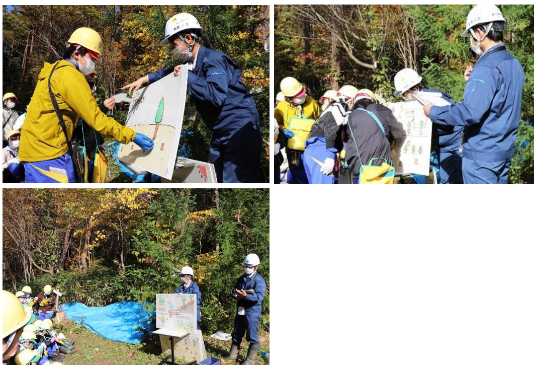
紙芝居で森林について学ぶ子供たち