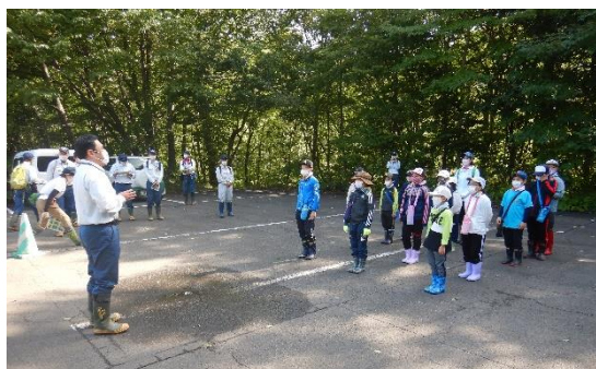
森林の働きについてのお話