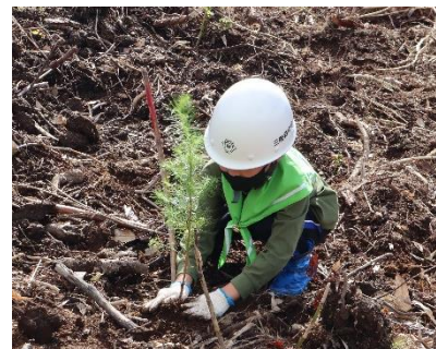
ディブルを使って植樹している様子