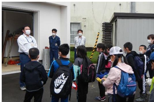
森林の働きについてのお話