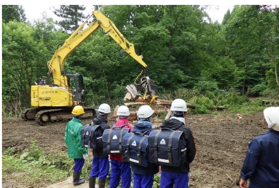
ハーベスタの見学