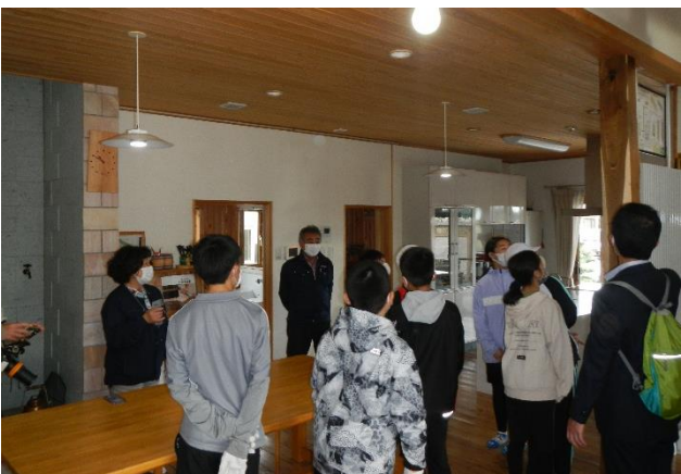
モデル住宅での説明