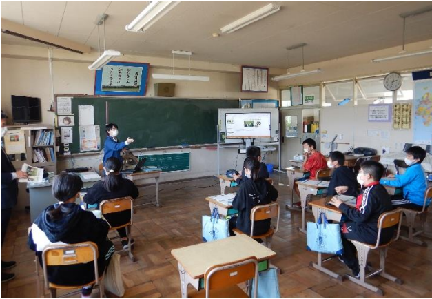
教室での事前学習