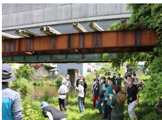
瀬辺地川鉄橋跡を見上げる参加者