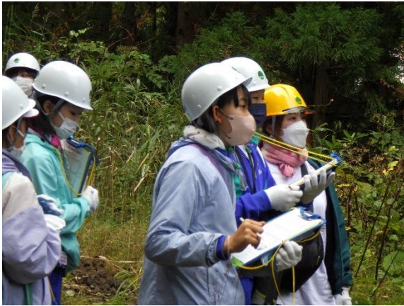
森林散策で植物を探す子供たち