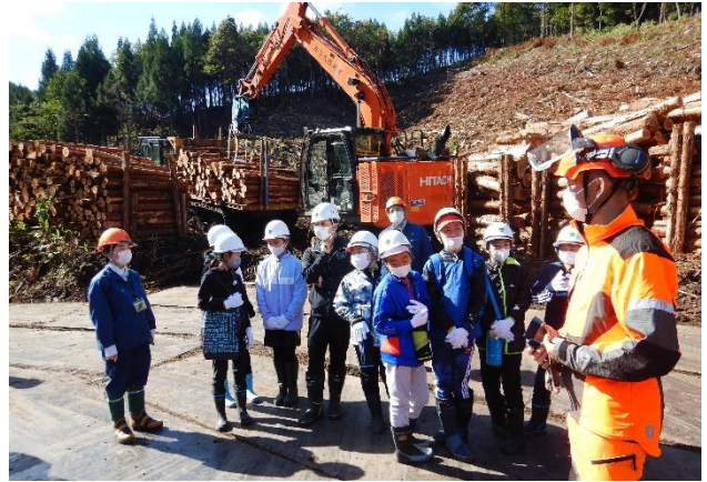
製品生産請負現場での説明