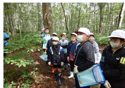
職員による森林の役割の説明