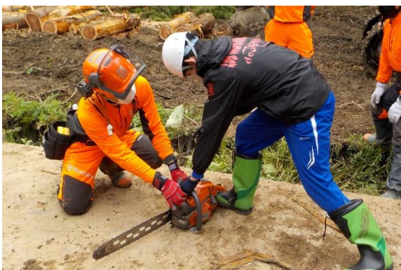
チェーンソーのエンジンをかける様子