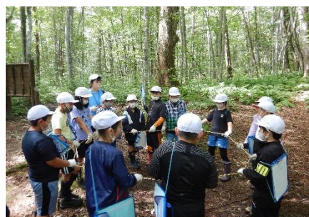
幹回りと同じロープで大きさを体感