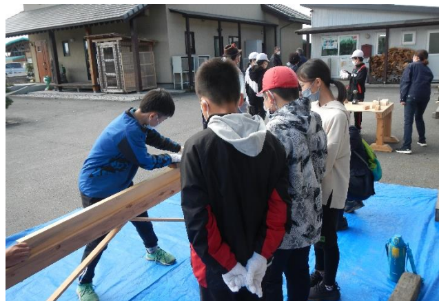
カンナ掛けの様子