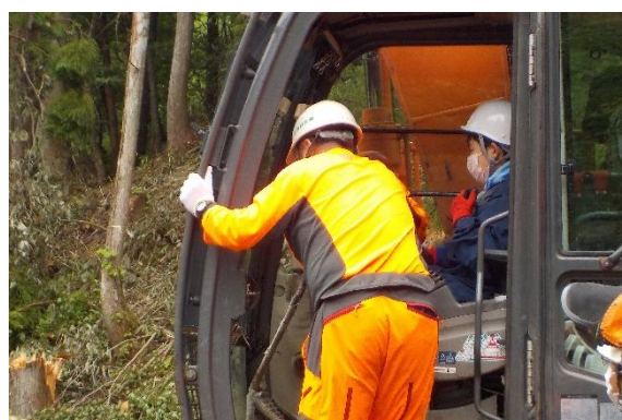
高性能林業機械の操縦体験