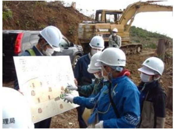
紙芝居に参加する子供たち