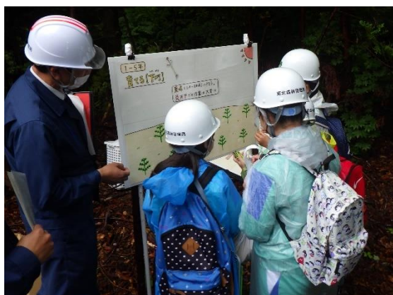
下刈を学ぶ生徒たち