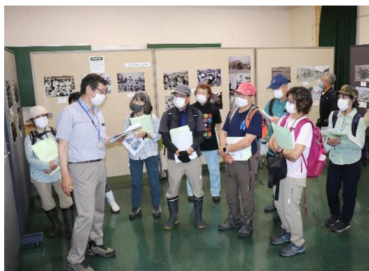
森林博物館の見学