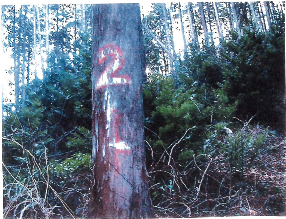
写 4 (II-4)