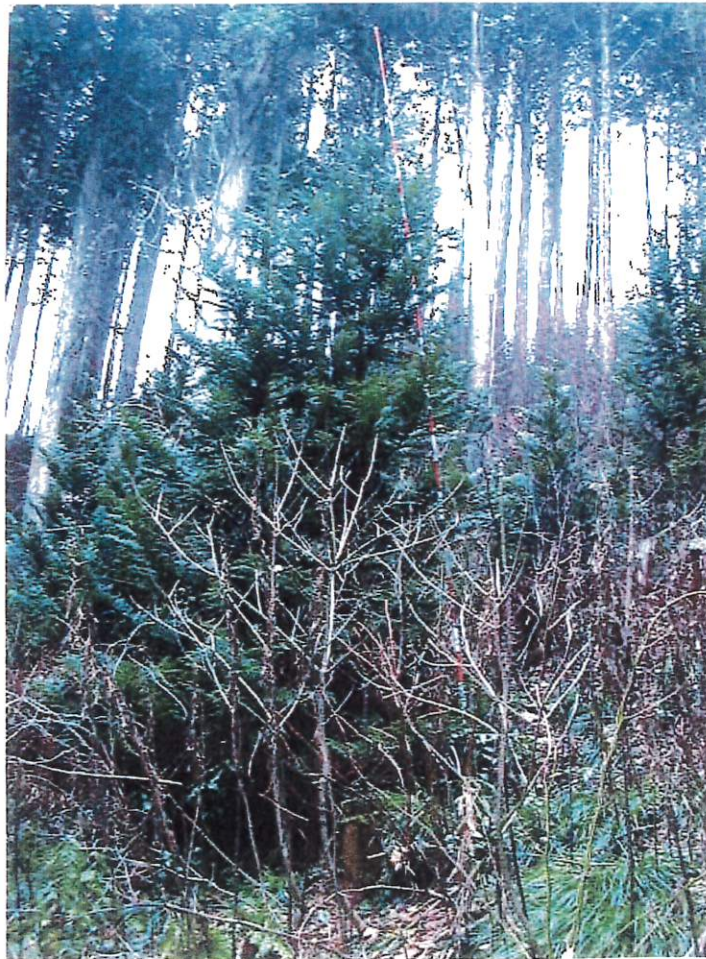
写 8 (IV-8)