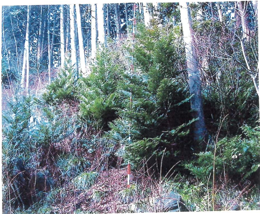
写 6 (Ⅲ-6)