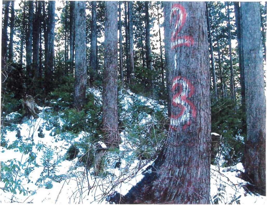
写 3 (II-3)