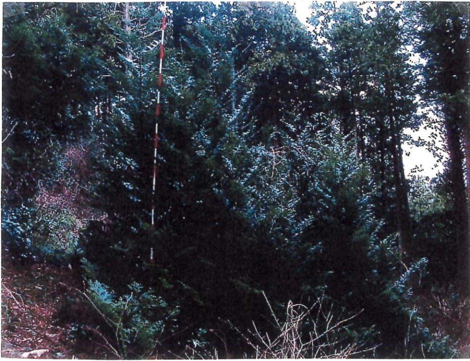
写 7 (IV-7)