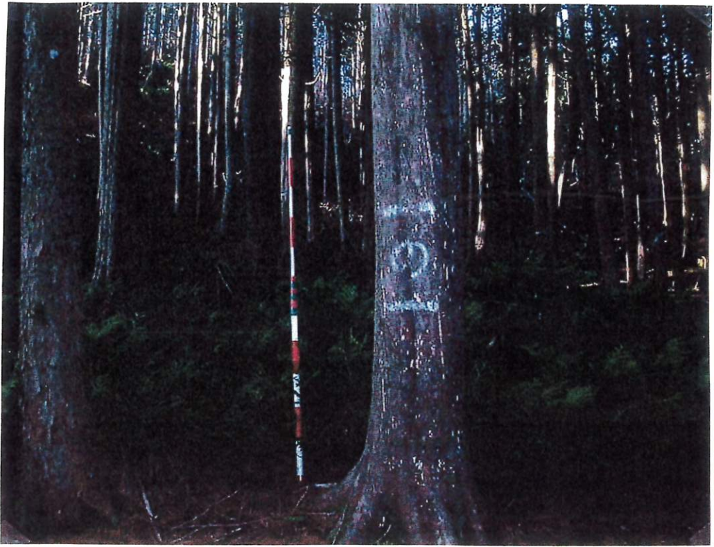
写 1 (I-1)