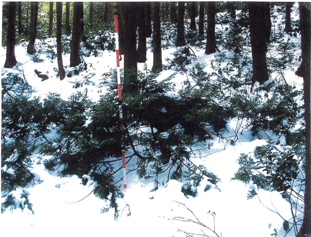
写 2 (I-2)