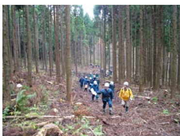
列状間伐箇所の案内