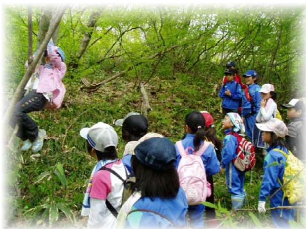
森で遊ぶ体験：神田妙見塾 (戸沢村)