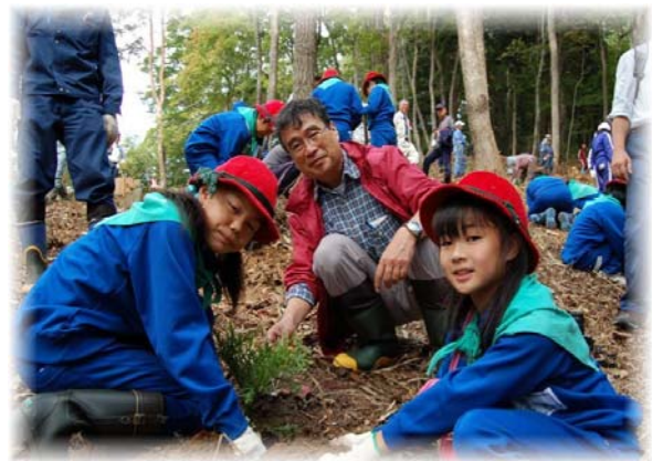
平成21年度平泉古事の森 植樹風景 (来賓立松和平氏と児童)

修復用資材の確保に寄与するため、関係機関、NPOと協力・連携を図りながら、200～400年という長期にわたる森林づくりに取り組む