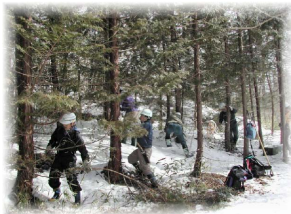
枝打ち体験：里山ねっと赤坂 (仙台市)