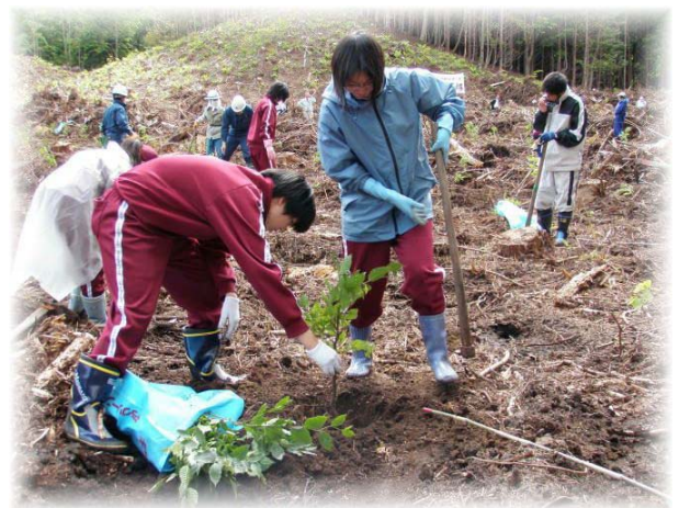
ブナ植樹体験：三本木高校・付属中学校 (十和田市)