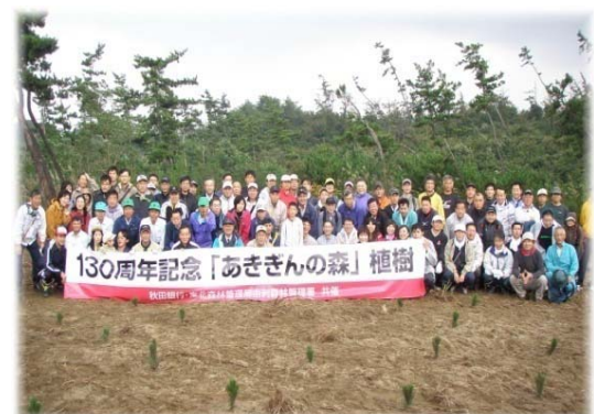
「あきぎんの森」海岸林植樹の様子