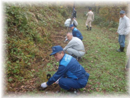
古道保全活動：黒沢峠敷石道保存会 (小国町)

象徴的な活動（古道(トレイル)保全活動、特定の保全対象を共同で維持管理するなどの範囲）、歩道の草刈、美化活動等を対象とする。