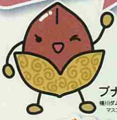
ブナミちゃん 横川ダム水源地域ビジョンの マスコットキャラクター