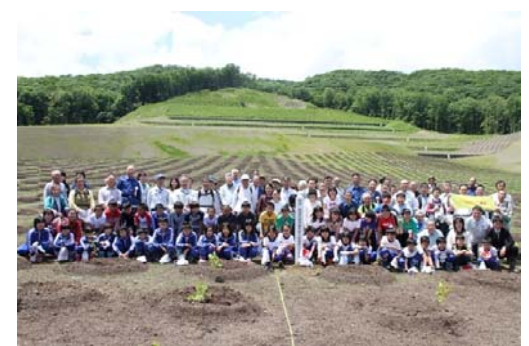
植樹記念標柱とともに

市野々原地区の災害復旧地において、地震から3年となった平成23年6月14日に地元小学校、地域住民および多くの一関市民にご参加いただき植樹祭を行いました。