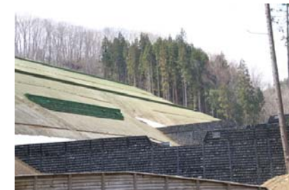
ニゴリ沢第一工区 [地すべり防止工事]