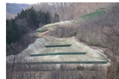
ニゴリ沢第二工区 [地すべり防止工事]