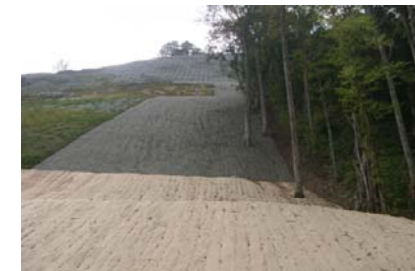
真湯(真湯キャンプ場) [山腹工]