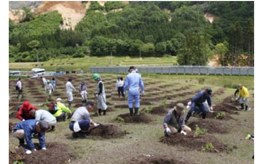
市野々原地区住民による植樹の様子