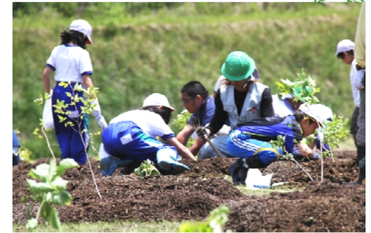
小学生による植樹の様子