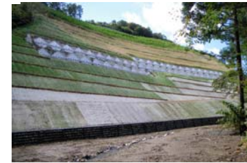
ニゴリ沢第二工区 【地すべり防止工事】