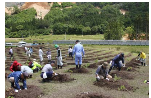
市野々原地区住民による植樹の様子