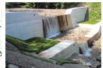
産女川【溪間工(谷止工)】