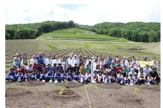
植樹記念標柱とともに

市野々原地区の災害復旧地において、地震から3年となった平成23年6月14日に地元小学校、地域住民および多くの一関市民にご参加いただき植樹祭を行いました。