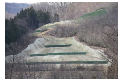
ニゴリ沢第二工区 [地すべり防止工事]