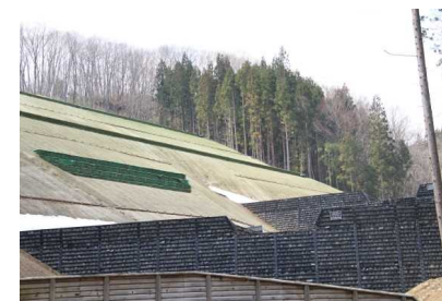
ニゴリ沢第一工区 [地すべり防止工事]