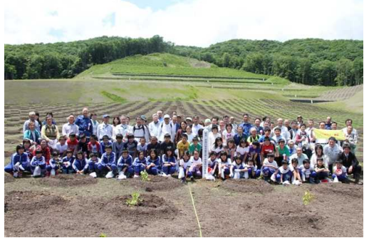
植樹記念標柱とともに

市野々原地区の災害復旧地において、地震から3年となった平成23年6月14日に地元小学校、地域住民および多くの一関市民にご参加いただき植樹祭を行いました。