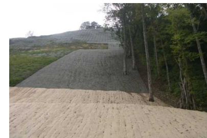
真湯(真湯キャンプ場) [山腹工]