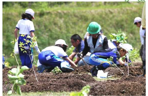
小学生による植樹の様子