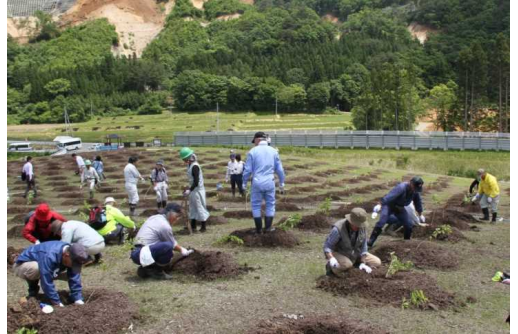
市野々原地区住民による植樹の様子