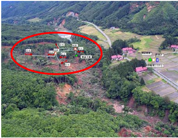
市野々原 伸縮計設置箇所

・磐井川・産女川・胆沢川 各地区に設置した土石流センサー、監視カメラからの情報では、現地の異常は確認されていません。(8月3日17:00現在)