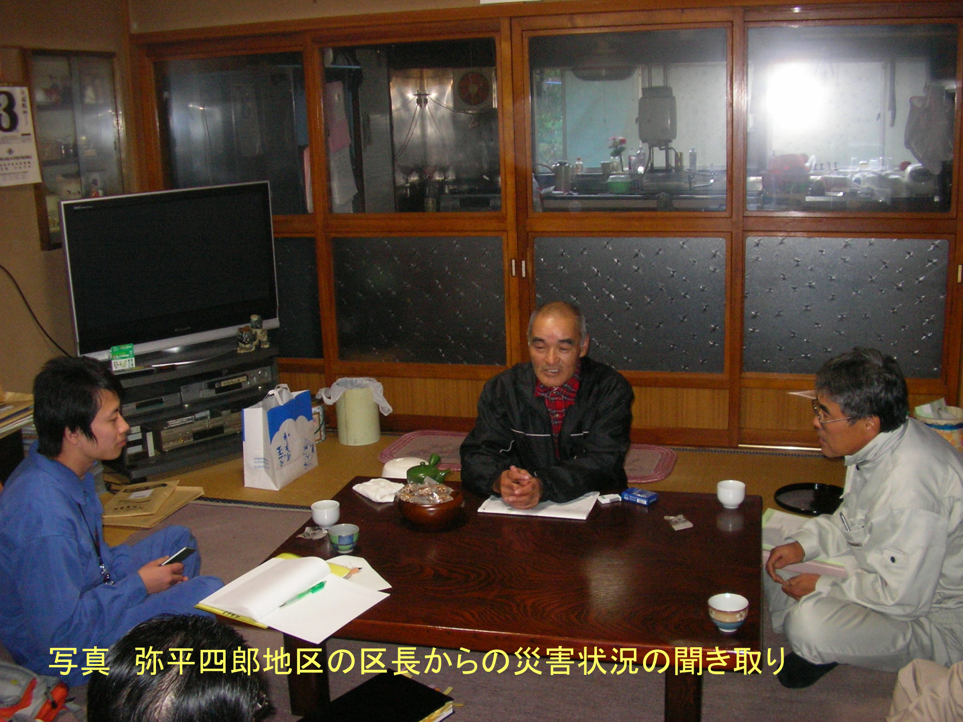
写真 弥平四郎地区の区長からの災害状況の聞き取り