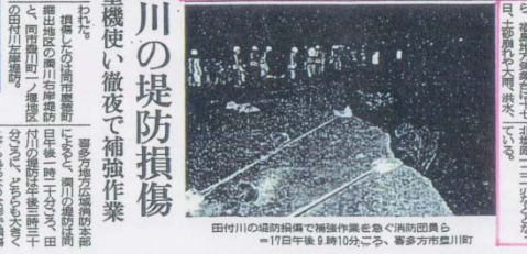
田付川の堤防損傷で補強作業を急ぐ消防団員ら 17日午後9時10分ごろ、喜多方市喜川町

西会津 只見で自主避難 只見町では、水防本部設置し情報収集 只見町では、水防本部を設置し、情報収集を行っている。また、只見町では、自主避難者が増えていると報告されている。 西会津 只見で自主避難 只見町では、水防本部を設置し、情報収集を行っている。また、只見町では、自主避難者が増えていると報告されている。