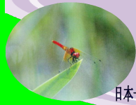
日本一小さい ハッチョウトンボ(オス)

と き 平成26年6月28日(土) 9時30分～ と ころ 西川町大井沢自然博物館前集合 西川町大井沢 カッチャバ湿原 参加対象 小中学生の親子30名 申し込み 朝日庄内森林生態系保全センター (問い合わせ) TEL 0235-58-1730 FAX 0235-58-1731 E-mail t_syounai_f@rinya.maff.go.jp