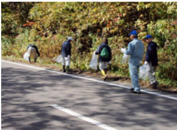
県道沿いクリーン作戦