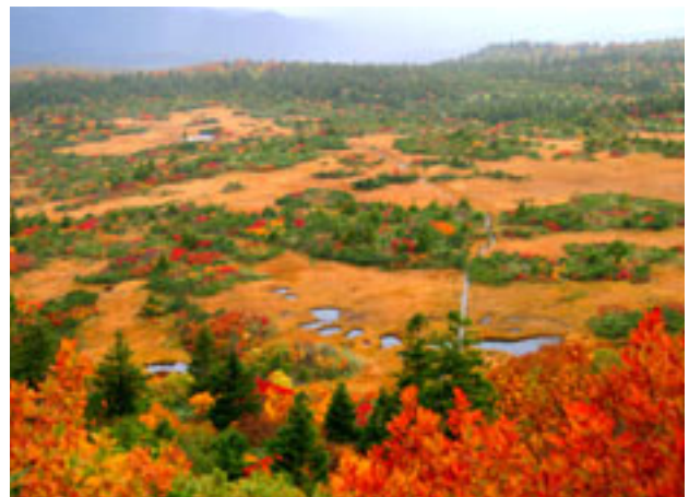
紅葉の下毛無袋の池塘群