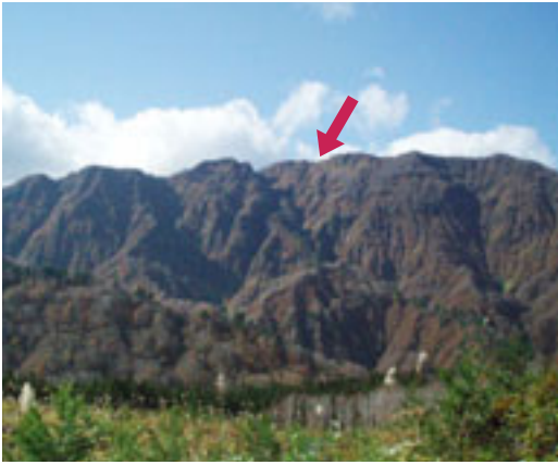
幾重にも山頂が重なって見えますが、頂上は矢印部分です

頂上からは、晴れた日には佐渡ヶ島、朝日連峰、月山、鳥海山、男鹿半島などを遠望できるところから最近では山ガール達にも人気が高く、秋にはカラフルなファッションに身を包んだ彼女達が紅葉に負けじと山を賑わしています。