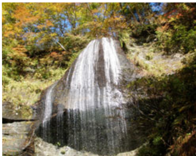
滝の白と紅葉の、美しいコントラスト