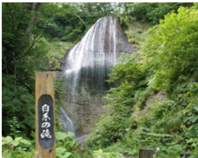
新緑まぶしい春の白糸の滝

落差約30メートルの滝の下には、水しぶき で小さな虹が時折見え隠れし、訪れたハイキ ング客はしばし癒やしの時間を味わっています。 また近くには「三滝不動明神」が祀られて います。