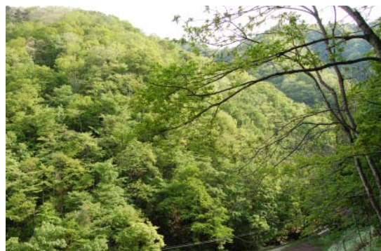
イヌブナ保護林遠景