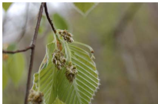
イヌブナ雄花・雌花