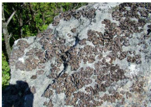
オオウラヒダイワタケ

下 北半島の佐井村に特徴的な形をした縫道石山（626m）があります。 縫道石山及び縫道石は、ヒノキアスナロ林地帯に突出する岩峰であって、岩石上にはイワタケ科に属するオオウラヒダイワタケが生育しています。本種は北米アパラチア山脈を中心とする地域に自生し、北米東部特産と考えられており、他にキザキナナカマド、コメバツガザクラ、ハクサンシヤクナゲ、ゴゼンタチバナ等も生育し、国の天然記念物に指定されており植物地理学、植物系統学上貴重な地域となっています。